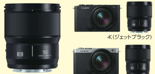
・K(ジェットブラック) ・D(キャメルオレンジ) ・S(ダークシルバー)

●外形寸法(約):幅126×高さ73.9×奥行46.7mm(突起部を除く) ●本体質量(約):486g(バッテリー、SDメモリーカード含む) ●レンズマウント:ライカカメラ社・L-Mount ●35mmフルサイズ(35.6mm×23.8mm)CMOSセンサー ●カメラ有効画素数:2,420万画素 ●付属レンズ:広角ズームLEICA S 18-40mm F4.5-6.3