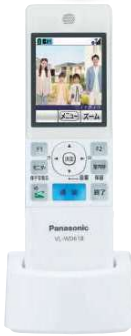
ワイヤレスモニター子機