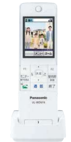
ワイヤレスモニター子機