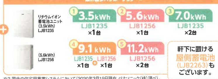
※2 国内の住宅用蓄電システムにおいて(2020年3月19日現在 パナソニック(株)調べ)。