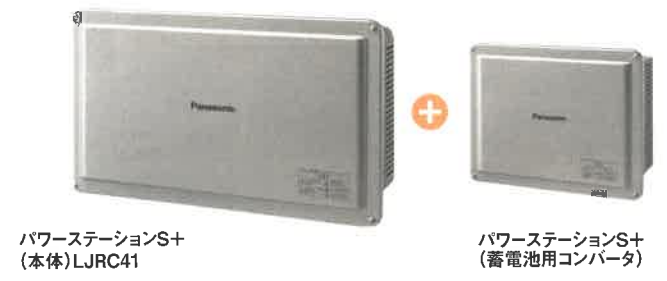
パワーステーションS+(本体)LJRC41 パワーステーションS+(蓄電池用コンバータ)