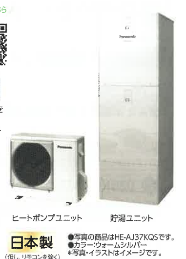
ヒートポンプユニット 貯湯ユニット 日本製 ●写真の商品はHE-AJ37KQSです。●カラー:ウォームシルバー ●写真・イラストはイメージです。(但し、リモコンを除く)